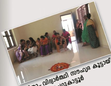
വനിതാ- വിദ്യാർത്ഥി സൗഹൃദ കുട്ടായ്മ ചെറുകാട്ടൂർ