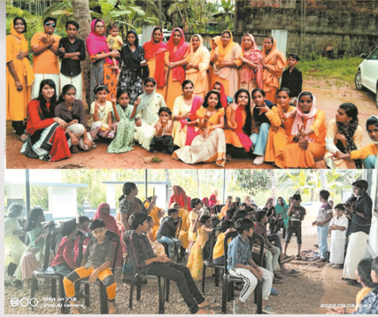
വനിതാ - വിദ്യാർത്ഥി സൗഹൃദ കുട്ടായ്മ - കമ്പളക്കാട്

2022 സെപ്റ്റംബർ 03 ന് മരിക്കത്തേരി, കമ്പളക്കാട്, സെപ്റ്റംബർ 04 ന് ചെറുകാട്ടൂർ, വെള്ളമുണ്ട, ചെമ്പുചിറ, സെപ്റ്റംബർ 05 ന് വാര്യാട്കുന്ന്, സെപ്റ്റംബർ 07 ന് വള്ളുവാടി, സെപ്റ്റംബർ 1 ന് പുലരി എന്നിവിടങ്ങളിൽ ഓണശോഷ പരിപാടികൾ സംഘടിപ്പിച്ചു. വിവിധ കലാ-കായിക പരിപാടികളും പാഠന വിതരണവും നടത്തി. വനിതാ-യുവജന-വിദ്യാർത്ഥി സൗഹൃദ കുട്ടായ്മകൾ നേതൃത്വം നൽകി.