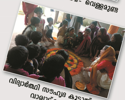
വിദ്യാർത്ഥി സൗഹൃദ കുട്ടായ്മ വാര്യാട്കുന്ന്