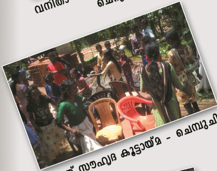
യുത്ത് സൗഹൃദ കുട്ടായ്മ - ചെമ്പുചിറ