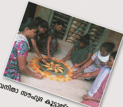
വനിതാ സൗഹൃദ കുട്ടായ്മ - പുലരി