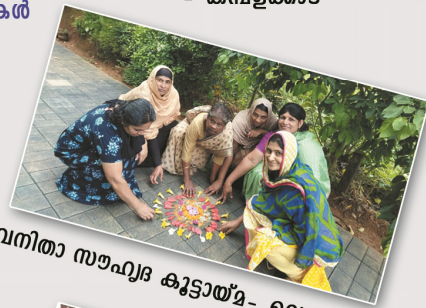
വനിതാ സൗഹൃദ കുട്ടായ്മ- വെള്ളമുണ്ട