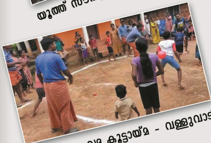
യുത്ത് സൗഹൃദ കുട്ടായ്മ - വള്ളുവാടി