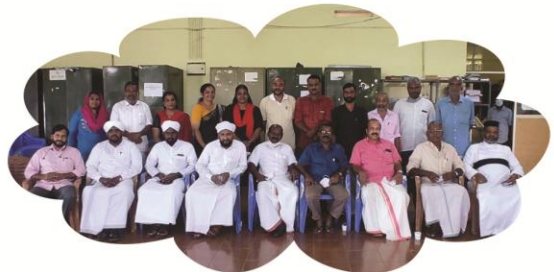
ഒക്ടോബർ 30 പുതാടി