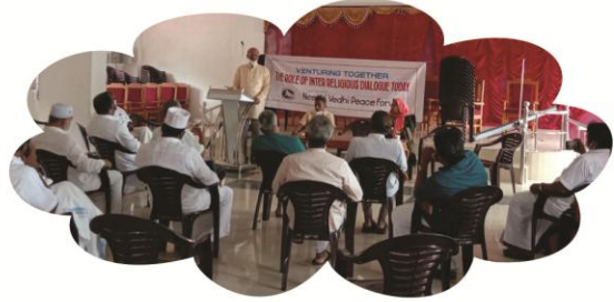
സെപ്റ്റംബർ 28 മുട്ടിൽ