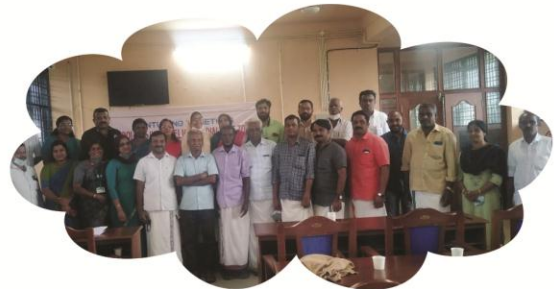
ഒക്ടോബർ 23 മുരപ്പെനാട്