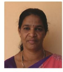
വത്സ ദേവസ്വ ഫീൽഡ് വർക്കർ - വൈത്തിരി താലൂക്ക്