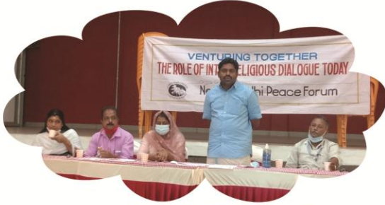
സെപ്റ്റംബർ 25 മീനങ്ങാടി

വിവിധ മതനേതാക്കളുടെ ഒത്തുചേരൽ പഞ്ചായത്ത് തലത്തിൽ സംഘടിപ്പിച്ചു. പരസ്പരം പരിചയപ്പെടാനും, പങ്കുവെയ്ക്കാനും, സ്നേഹവും സൗഹൃദവും വർദ്ധിപ്പിക്കാനും ഈ ഒത്തുചേരൽ ലക്ഷ്യമെടുക്കുന്നു.