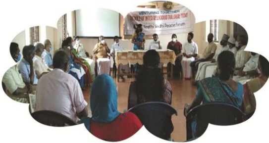
ഒക്ടോബർ 20 കണിയാമ്പുറം