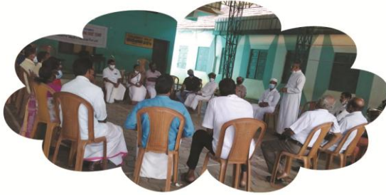
ഒക്ടോബർ 2 മാനന്തവാടി