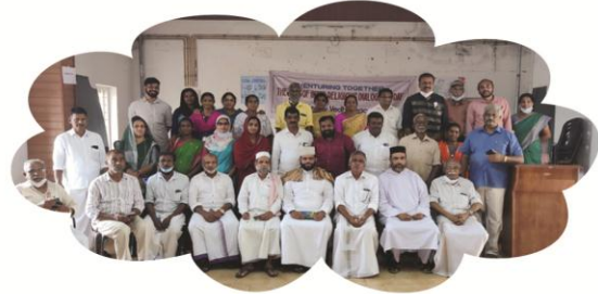
ഒക്ടോബർ 16 മേപ്പാടി