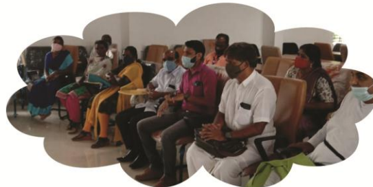
ഒക്ടോബർ 27 കൽപ്പറ്റ