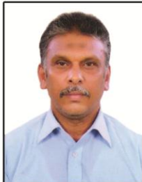
സിദ്ധിഖ് എക്സിക്യൂട്ടീവ് മെമ്പർ