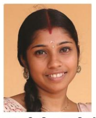
ജൂബിലി അനിഷ് ഡോക്യുമെന്റേഷൻ & കമ്പ്യൂട്ടർ ഓപ്പറേറ്റർ